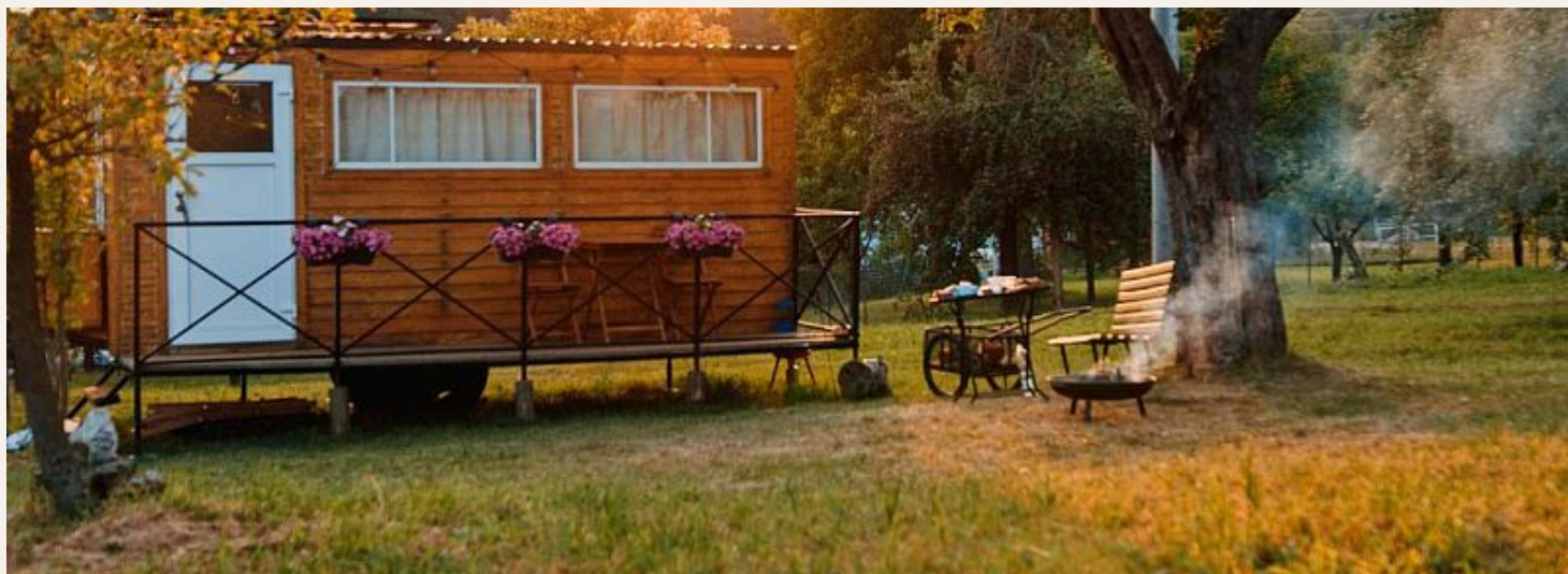
ZHOŘOVI A JEJICH MARINGOTKA V KADLATÍ, ZNAČKA JAK BEJK